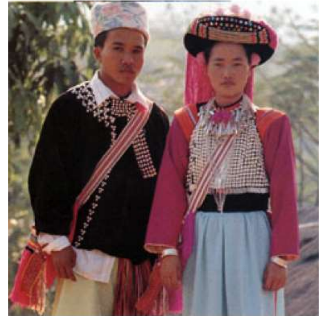
การแต่งกายของชนภูเขาเผ่าลีซอ