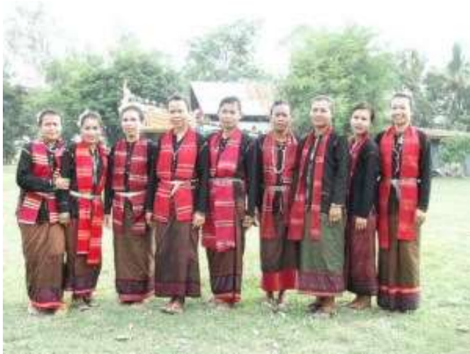
เครื่องแต่งกายชาติพันธุ์ล้านนา ไทยวน-โยนก

“ล้านนา” ในปัจจุบันหมายถึงอาณาเขต 8 จังหวัดภาคเหนือตอนบนของประเทศไทยได้แก่ จังหวัดเชียงใหม่ เชียงราย พะเยา ลำพูน ลำปาง แพร่ น่าน และแม่ฮ่องสอน การแต่งกายพื้นเมืองของล้านนาจึงหมายถึงการแต่งกายของชนกลุ่มต่างๆ ที่อาศัยอยู่ในล้านนาในอดีต อาณาจักรล้านนาในบางยุคสมัยอาจครอบคลุมไปถึงรัฐต่างๆ เช่น สิบสองปันนา รัฐฉาน เชียงตุง เป็นต้น ซึ่งต่างก็เคยมีความสัมพันธ์กันมาช้านาน ชนกลุ่มใหญ่ที่สร้างสมอารยธรรมในล้านนาก็คือ “ชาวไทยวน” ซึ่งปัจจุบันเรียกตัวเองว่า “คนเมือง” นอกจากนี้มีวัฒนธรรมกลุ่มชนต่างๆ ผสมผสานกัน ได้แก่ ชาวไทลื้อ ไทเขิน ไทใหญ่ (ไต) ชาวไทยวนในล้านนามีวัฒนธรรมในการทอผ้าเพื่อใช้สอยและแต่งกายเป็นเอกลักษณ์มาแต่โบราณ จากหลักฐานด้านจิตรกรรมฝาผนังวัดต่างๆ ในเชียงใหม่และน่าน ในเชียงใหม่เช่นวัดบวรศรีรัตนาราม วัดพระสิงห์วรมหาวิหาร และวัดป่าแดด