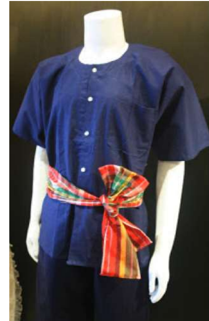
ผ้าหม้อฮ่อม

ลักษณะการแต่งกายของหญิงลีซอมีความโดดเด่นมาก ตั้งแต่ ผ้าโพกหัว ที่เป็นทรงป้านกลม ตกแต่งด้วยลูกปัดและพู่ประดับหลากสี เวลาสวมใส่จะส่งให้ใบหน้าของผู้หญิงดูโดดเด่น สวยงาม เสื้อตัวยาว ตัดเย็บด้วยผ้าสีสดใสตกแต่งด้วยริ้วผ้าเล็กๆ สลับสี สวมทับ กางเกงขายาว ครึ่งน่องสีดำ มีผ้าคาดเอวที่เมื่อคาดแล้วจะทิ้งชายไปทางด้านหลังเป็น พู่หางม้า ทำจากผ้าหลากสีเย็บเป็นไส้ไก่เส้นเล็กๆ จำนวนกว่า 100 เส้น ขึ้นไป เมื่อเคลื่อนไหว พู่จะกวักแกว่งไปด้วยดูน่ารักสวยงามมากและสวม สนับแข้งสีสด หญิงสาวและหญิงสูงอายุแต่งกายคล้ายกันแต่ต่างกันเฉพาะ การใช้สี ซึ่งในกลุ่มหญิงสูงอายุจะใช้สีขรึมเข้มกว่า และผ้าโพกหัวก็ใช้ผ้า สีดำโพกพันไว้ ไม่มีลูกปัดและพู่ประดับ ผู้ชายสวมกางเกงสีสด และสาวเสื้อ สีดำตกแต่งด้วยเม็ดเงินคาดเอว ประดับด้วยพู่หางม้าทำจากผ้าเย็บเป็น ไส้ไก่สลับสี เวลาคาดเอวจะทิ้งชายลงมาทางด้านหน้า เด็กๆ ยังคงสวมใส่ ชุดประจำเผ่าให้เห็นโดยทั่วไป