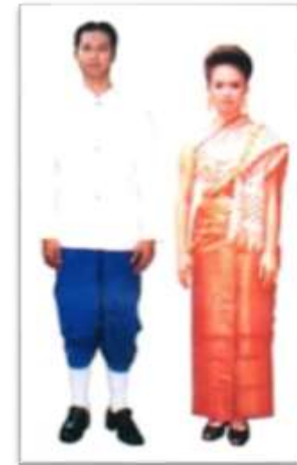
ภาคกลางและภาคตะวันออก

การแต่งกายในชีวิตประจำวันทั่วไป ชายนุ่งกางเกงครึ่งน่อง สวมเสื้อแขนสั้น คาดผ้าขาวม้า ส่วนหญิง จะนุ่งซิ่นยาว สวมเสื้อแขนสั้นหรือยาว การแต่งกายผ้าขาวม้า ภาคกลาง จะมีลวดลายเป็นตารางสก๊อต เรียกว่า “ผ้าขาวม้า”