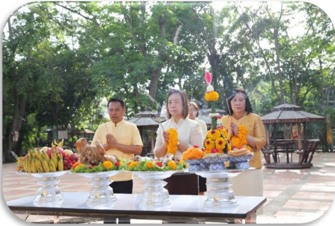
ภาพพิธีวางศิลาฤกษ์ ณ มหาวิทยาลัยราชภัฏจันทรเกษม