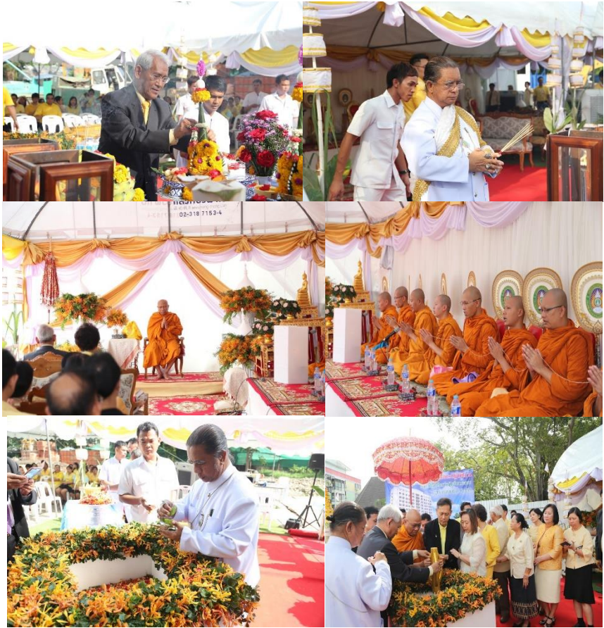
ภาพพิธีวางศิลาฤกษ์ ณ มหาวิทยาลัยราชภัฏจันทรเกษม