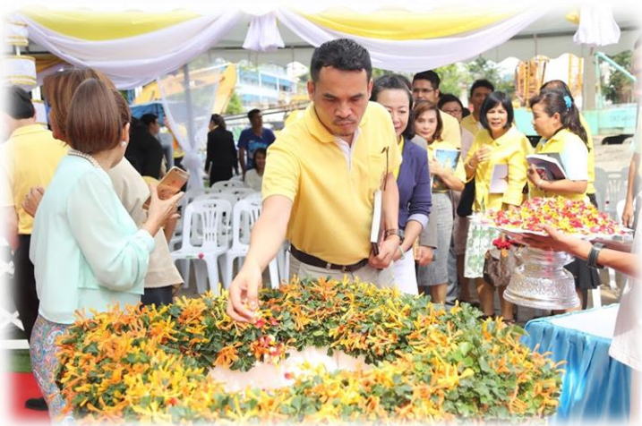
ภาพพิธีวางศิลาฤกษ์ ณ มหาวิทยาลัยราชภัฏจันทรเกษม