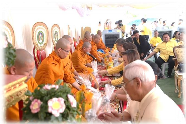
ภาพพิธีวางศิลาฤกษ์ ณ มหาวิทยาลัยราชภัฏจันทรเกษม